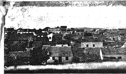
ALFARELOS — Uma vista parcial

Nascida a ideia entre um reduzido grupo de meia dúzia de indivíduos que se propuzeram festejar esta data, embora sucintamente, é-nos grato registar a alegria e o carinho com que nos rodeou o povo da nossa terra, sinal bem nítido e sintomático de que não se apagou entre nós a chama do bairrismo, salvo raríssimas excepções com que todos, e em toda a parte, terão de contar. A todos os que deram a sua colaboração escrevendo ou anunciando neste jornal, ou incitando-nos para que prosseguissemos no nosso intento, vão os nossos agradecimentos.