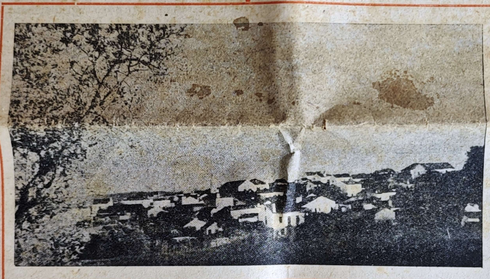
VISTA PARCIAL DE ALFARELOS

Deseja-se que «Jornal de Alfarelos» sirva para que se estreitem num fraternal abraço todos os alfarelenses dispersos pelas sete partidas do Mundo e, que a meditação sobre o que valemos e sobre o que podemos vir a valer, se nos soubermos unir, tenha a força de fazer reacender o adormecido bairrismo de muitos.